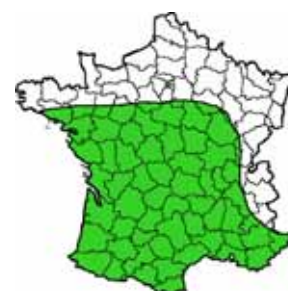
■ Zone de culture