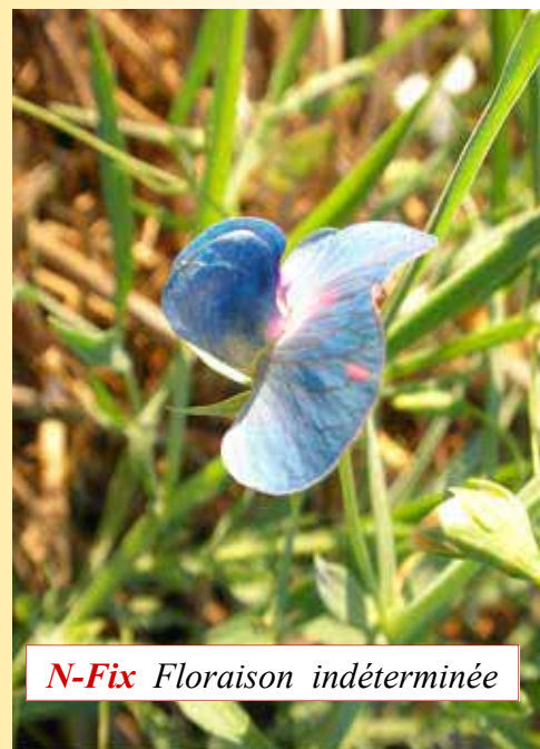
N-Fix Floraison indéterminée

N-Fix possède une forte capacité de fixer puis restituer l'azote : cette caractéristique lui permet de modifier durablement les modes de fumures azotés traditionnels tant au niveau des exploitations de types conventionnelles que biologiques.