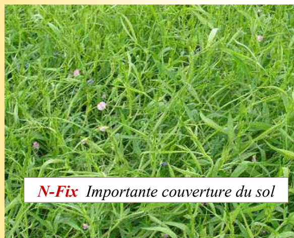
N-Fix Importante couverture du sol