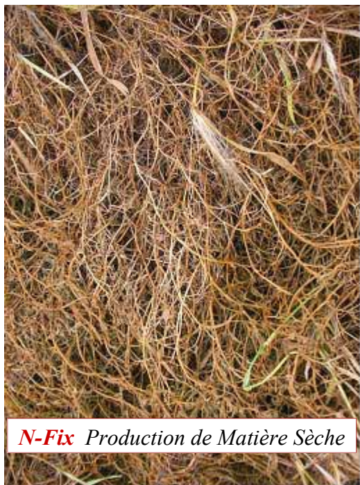
N-Fix Production de Matière Sèche

Il est facile d'estimer la production d'azote : chaque étage de 30 cm de végétation au dessus du sol génère environ 1 tonne de matière sèche soit 40 unités d'azote / ha (ou 4 % d'azote sur la matière sèche produite).