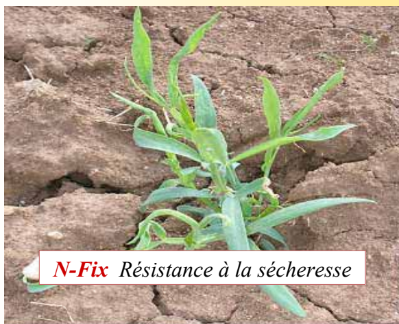
N-Fix Résistance à la sécheresse